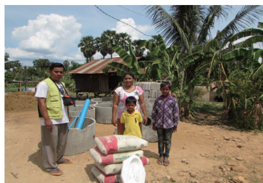
トイレ建設用の資材

グッドネーバーズがつくったトイレは、その悩みの解消だけでなく、不衛生な環境による病気のための医療費が減り家計が良くなる、病気で休みがちだった子ども達も学校に元気に通えるようになるなど、たくさんの幸せを家族にもたらすことになりました。